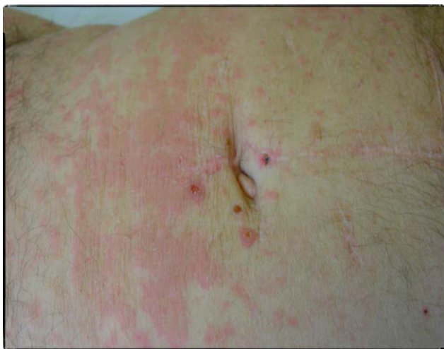
Figuras 1 y 2 Placas eritematoescamosas con lesiones de rascado en el tronco.