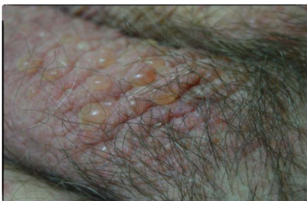
Figura 3 Ampollas tensas en el escroto.